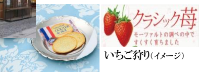
ガトーフェスタハラダ(イメージ)