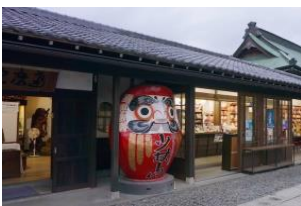
少林山達磨寺(イメージ)