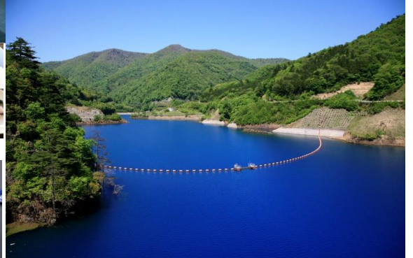
奥四万湖(イメージ)