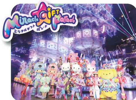
パレードに合わせて光る! 応援グッズ ミラクル♡ライト 好評発売中!