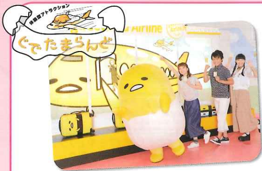
サンリオピューロランドに突如現れた「ぐでたまらんぞ」。そこはにせたまさんの妄想の世界。ぐでたま愛にあふれたこの世界で、君は何を見るのか…？(ストロベリーホール)