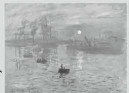
クロード・モネ「印象、日の出」1872年 Musée Marmottan Monet, Paris 9/19-10/15までの限定展示